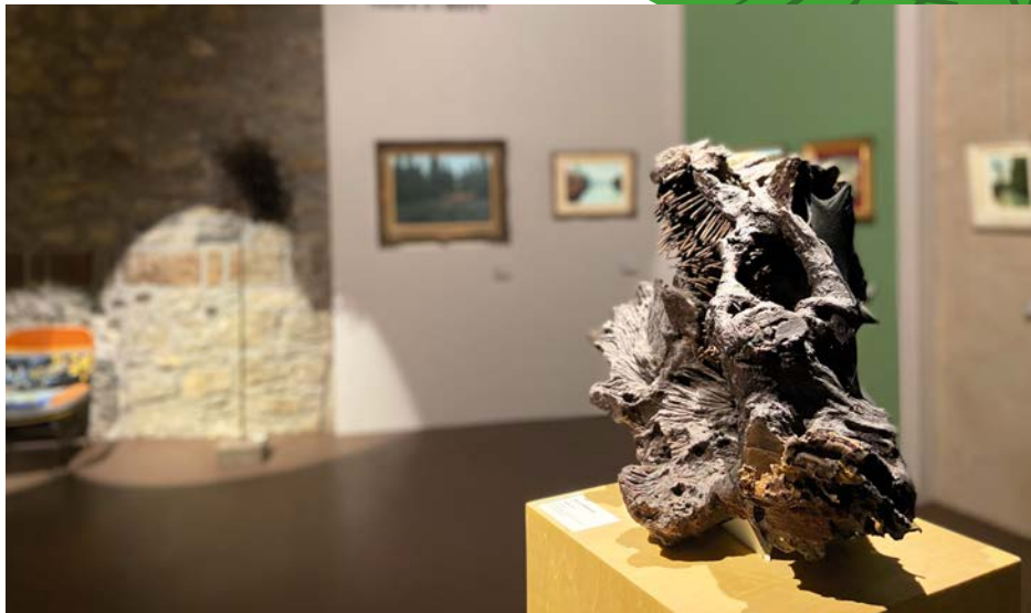
MANAS - Collection permanente