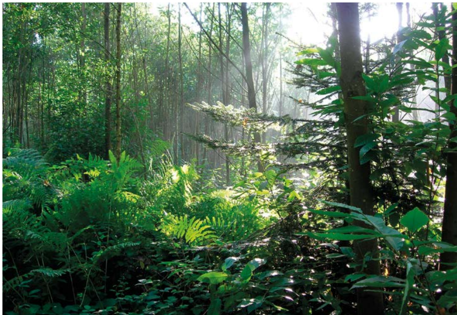
Bois de L'Huisserie