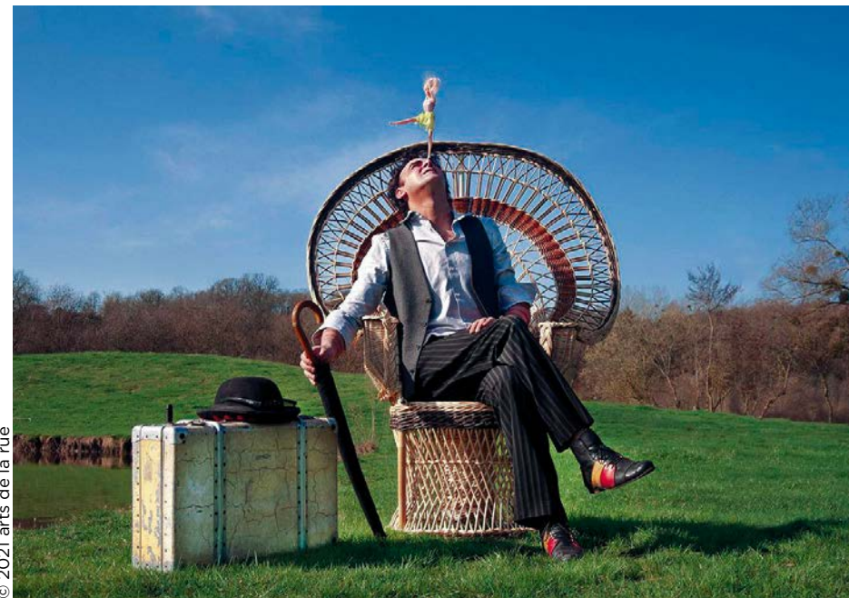
© 2021 arts de la rue

Playground - Collectif Primavez (cirque) 16 août / 19h / Port-Brillet, Parc Docteur A.Augeard