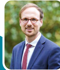
Florian Bercault Maire de Laval Président de Laval Agglomération