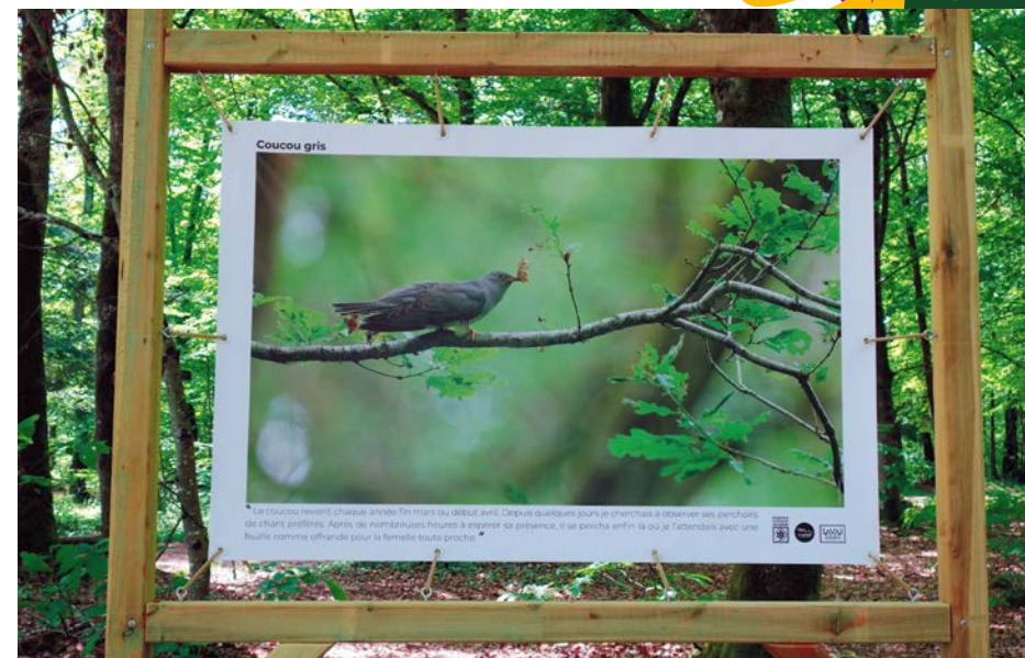
Exposition extérieure - Pris sur le vif