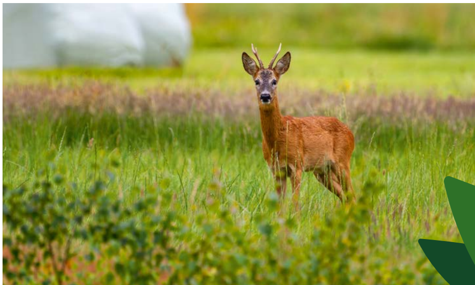
Brocard - Traces et indice