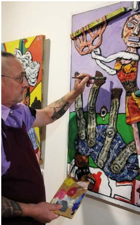
Le Casse du siècle

De 18 mois à 3 ans / gratuit / sur réservation au 02 53 74 12 30