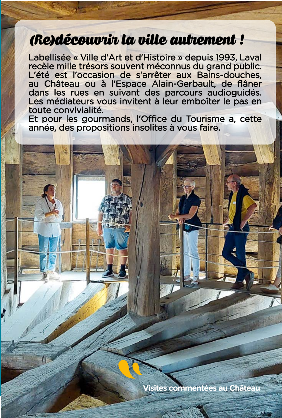
Visites commentées au Château

Labellisée « Ville d'Art et d'Histoire » depuis 1993, Laval recèle mille trésors souvent méconnus du grand public. L'été est l'occasion de s'arrêter aux Bains-douches, au Château ou à l'Espace Alain-Gerbault, de flâner dans les rues en suivant des parcours audioguidés. Les médiateurs vous invitent à leur emboîter le pas en toute convivialité. Et pour les gourmands, l'Office du Tourisme a, cette année, des propositions insolites à vous faire.