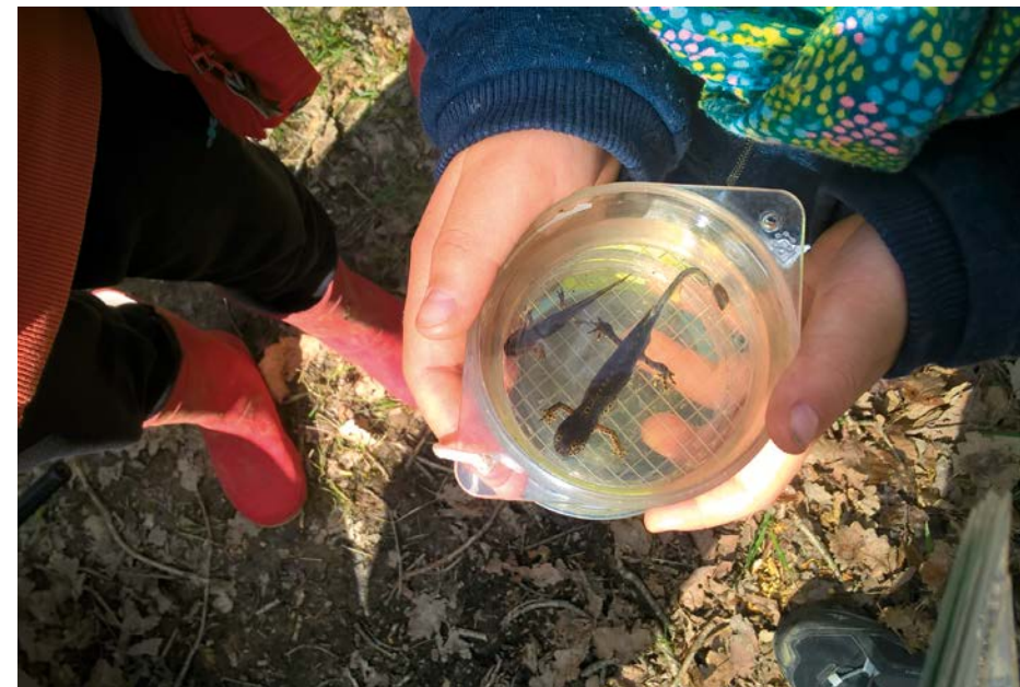
Mare et triton

Venez en famille avec vos petits bouts pour vivre un moment en nature. Réservation obligatoire au CIN Gratuit / Public : enfants entre 18 mois et 5 ans accompagnés d'un adulte.