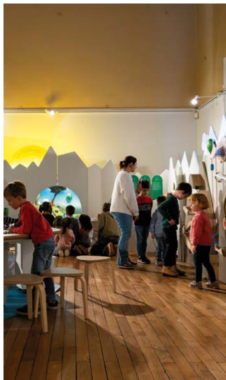
Zoom - Exposition " Fragile ! "

Pour les 2-6 ans / Tarifs : Adulte : 3€ ; enfant à partir de 2 ans : 2€ ; Carte ICOM, demandeur-euse d'emploi : gratuit