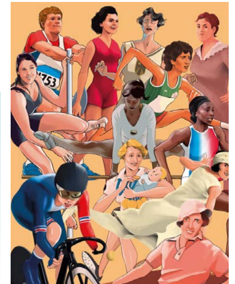
Des femmes en or

Dans le cadre de l'exposition, une projection gratuite du documentaire " Les incorrectes " aura lieu au cinéma L'Avant-scène le mardi 9 juillet à 20h30.