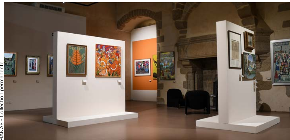
MANAS - Collection permanente