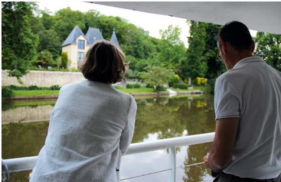
Dîner croisière en musique