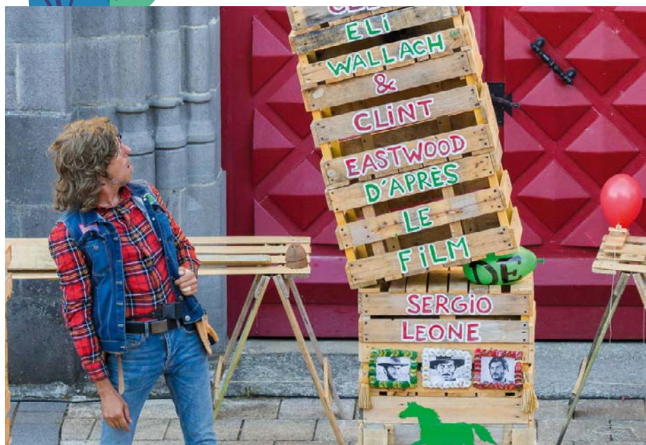
© Le magnifique bon à rien

Tout le programme détaillé sur agglo-laval.fr ou laval.fr Renseignements 02 53 74 12 00