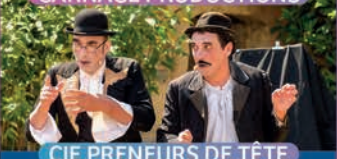
CIE PRENEURS DE TÊTE