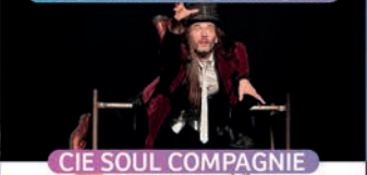
CIE SOUL COMPAGNIE