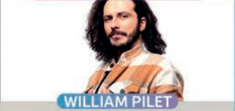
CIE A FLEUR DE SCÈNE