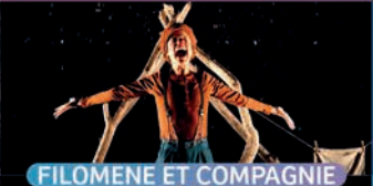
FILOMENE ET COMPAGNIE