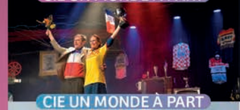
CIE UN MONDE À PART