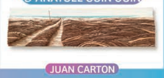
JEAN-PHIL SÈVÈRE & ANATOLE QUIN QUIN