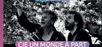
CIE UN MONDE À PART